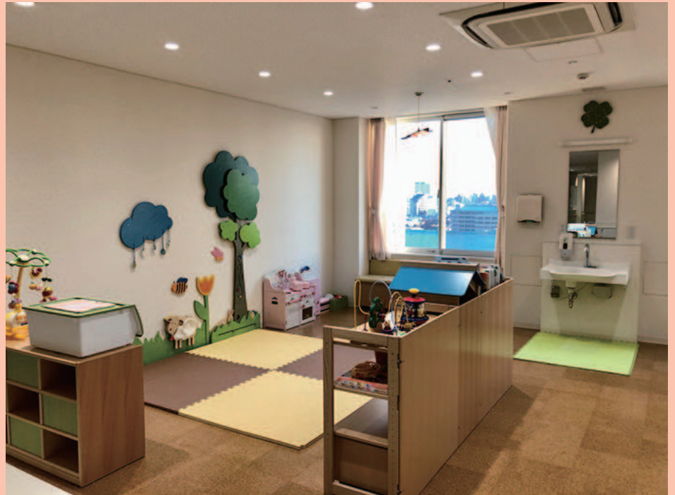
写真右 プレイルーム