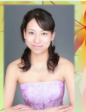
ソプラノ独唱 Soprano solo